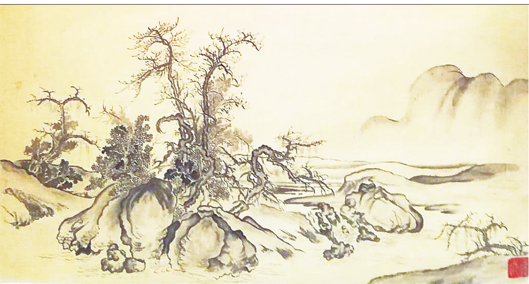
窠石平远图 唐福娥 绘

在绘画界,一直存在一种说法,说画家只是那么随意一画,并不是要表达什么,但评论者会呱呱说一堆象征什么啊隐喻什么啊,进行“过度阐释”。这样的说法