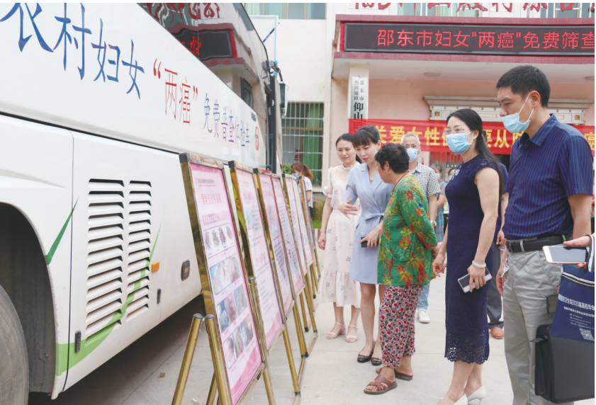
▲群众在宣传展板前了解“两癌”相关知识。

从2016年开始,邵东市医疗专家服务队每年轮回到各个乡镇(场)、社区,对35岁至64岁农村和城镇低保适龄妇女进行“两癌”免费检查,收到了良好的效果。2017年至2019年,共免费检查50114人,发现宫颈癌14人,宫颈高度病变39人,宫颈低度病变10人,乳腺癌33人,并对发现的阳性病人给予科学的诊疗建议。