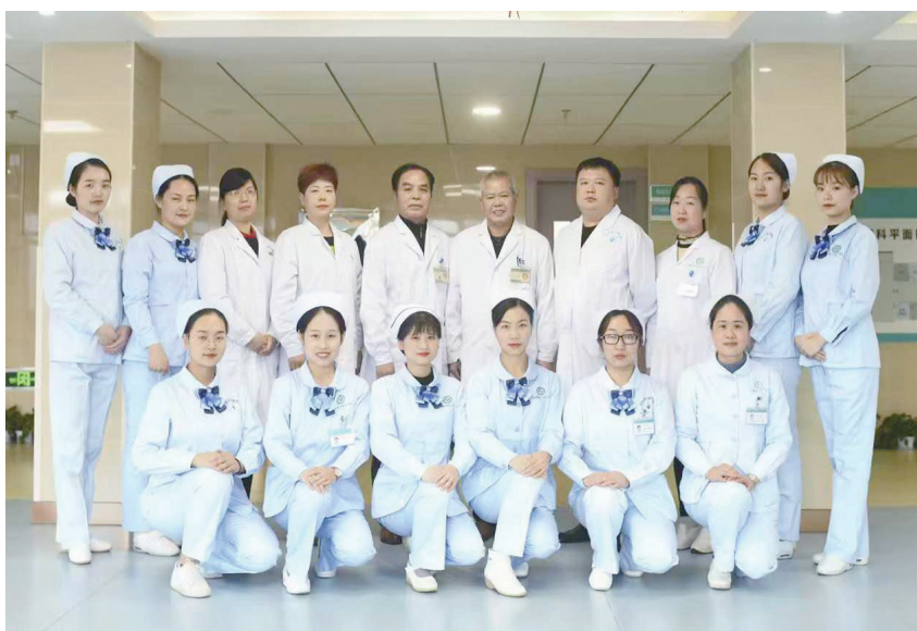
▲邵阳学院附属第二医院预防保健科医疗团队。

2019年3月,科室整体改造装修升级后,占地面积约2000平方米,设内科、外科、眼耳鼻喉科、妇科等专科体检。科室仪器设备精良,汇聚了医院各专科科室优秀的技术骨干和资深专家,拥有一支由医、技、护、(健康管理师)专业技术人员组成的健康管理学科队伍,形成了强有力的医疗质量保障体系。