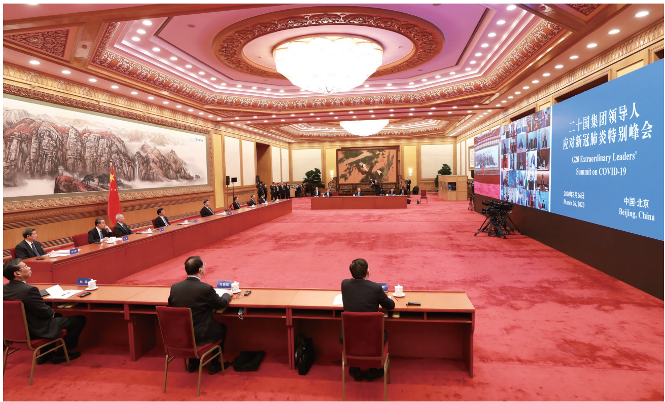
▲3月26日,国家主席习近平在北京出席二十国集团领导人应对新冠肺炎特别峰会并发表题为《携手抗疫 共克时艰》的重要讲话。