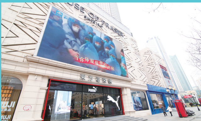
南京新街口东方福来德百货