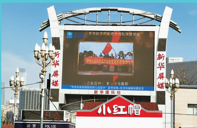
北京火车站站前广场

此次展播不仅对外展示了邵阳人民的勇善形象,更让不少邵阳游子触动心弦、惊喜不已。本版特刊登两篇来稿,与读者共享游子因邵阳元素闪耀异乡而引发的思考。