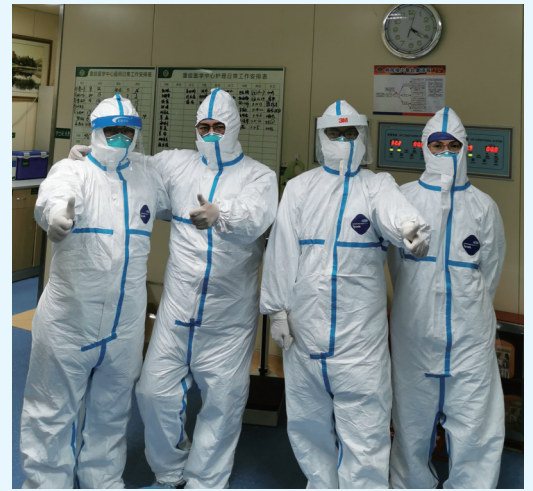
▲市中心医院ICU医护人员相互打气鼓劲。