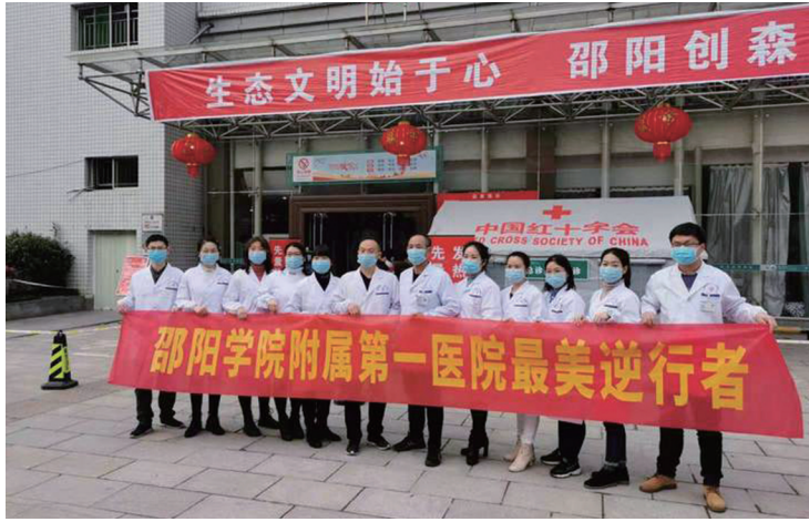
▲邵阳学院附属第一医院驰援湖北医疗队队员们合影。