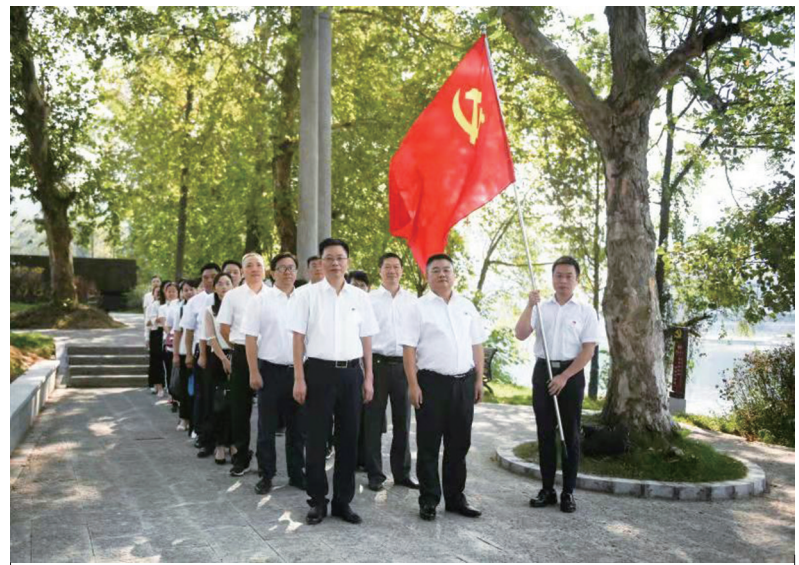
▲9月28日,邵阳学院附属第二医院党委组织开展“不忘初心,牢记使命”主题教育活动,医院党委班子成员集体来到邵阳县塘田战时讲学院旧址,接受了一堂深刻的革命传统教育课。

随着社会的不断进步和发展,精神卫生问题越来越受到政府、社会公众的广泛关注,由于各级政府各部门对精神卫生事业的重视与关爱。今年以来,市庆精神病院开设了临床心理与睡眠障碍科,科室收治病人范围有抑郁障碍、焦虑障碍、适应障碍、强迫及相关障碍、创伤及应激相关障碍、躯体症状及相关障碍及各种类型的睡眠障碍失眠症等,开展以个体为中心的心理咨询和治疗,也可开展团体作业治疗、正念减压、放松治疗、舞动治疗、艺术治疗等心理疗法,对于从业压力、考试压力、心理困惑、睡眠障碍等采取不同的疗法,进行精准治疗。