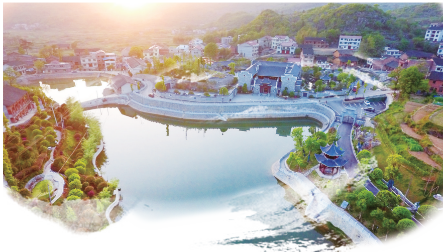
斫磗乡柳岸公园。邵阳日报记者 申兴刚 摄