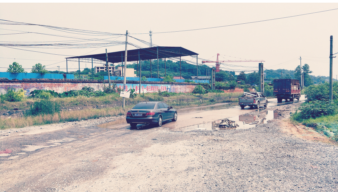
车辆在金罗湾至资江农药厂路段艰难行驶。邵阳日报记者袁光宇摄于7月2日

根据法律规定，烟草烟雾损害可以构成侵权责任。但律师表示，被动吸烟损害的索赔标准很难确定。目前禁烟主要还是寄希望于提高控烟的社会共识，让公众增强对吸烟危害身体健康的认识，也让吸烟者提高法律意识，尊重不吸烟者的权利，最终实现逐步戒烟。