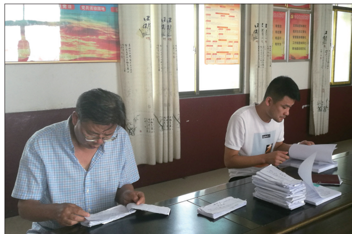
为督促各地各学校切实落实国家、省、市关于防溺水等重点工作的要求,强化安全意识,建立健全安全管理长效机制,确保全市教育系统安全稳定,7月下旬,市教育局派出督查组,就全市预防学生溺水、暑假期间校车管理、各校暑假安全防护情况等重点工作进行了专项督查。图为督查组在隆回县雨山镇检查预防学生溺水工作的相关资料。

“在毕业生毕业时,一些高校的老师往往要求学生在毕业后的两个月内到生源地所在教育局办理报到。而早在几年前市教育局就业办就作出决定,应届毕业生不需要在报到证上注明的时间回来报到,这对毕业生不会有任何影响。”就业办工作人员表示,《报到证》不过期,不作废,不过广大毕业生要永久保管好报到证,切勿遗失。如果应届毕业生要把户口迁回原籍,持《户口迁移证》和《报到证》回原籍地派出所落户即可,不需要到市教育局就业办来办理落户手续。