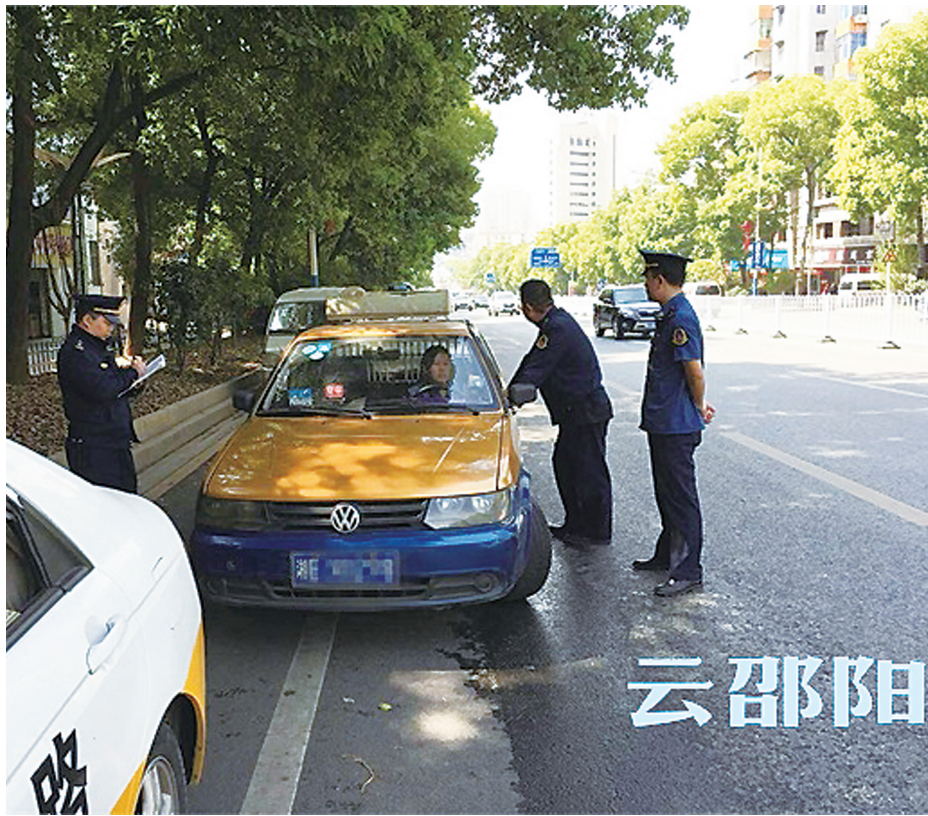
邵阳市交通运输综合行政执法支队在市区开展“打非治违”专项行动,打击出租车不打表、拒载、强行拼客等违规行为。

“对于网友反映的这个问题,我们也表示能够理解。如果按照正常情况打表的话,中途载客对于初始乘客来说是很不公平的,不过,倘若协商合理的话也不是完全不可以。”该负责人解释说:“由于之前县城大部分出租车不能正常打表,这个情况才会比较多。我们在近期会给所有的出租车更换新的计价表,争取在很大程度避免这个情况的出现。”