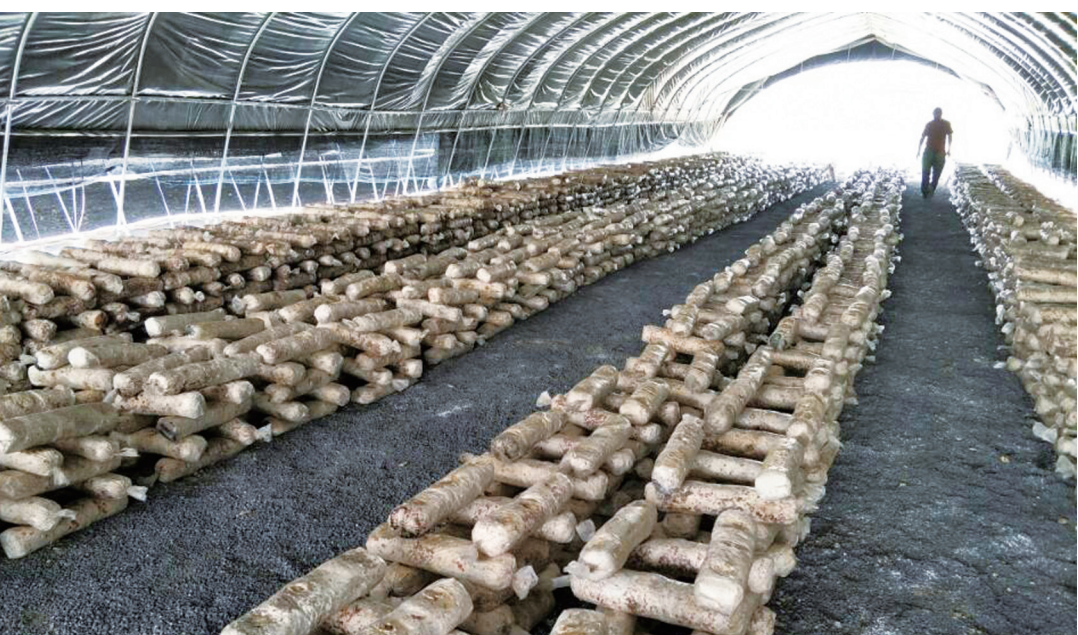
在寸石镇南岳村,云新高科已搭建起30多个食用菌种植大棚。