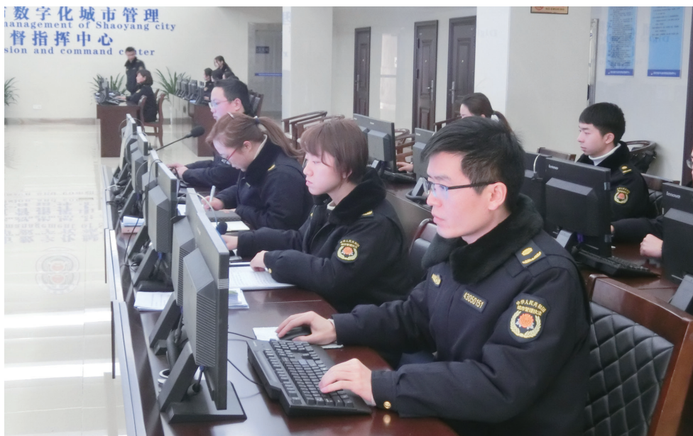
市数字化城市管理监督指挥中心工作人员在收集实时信息。