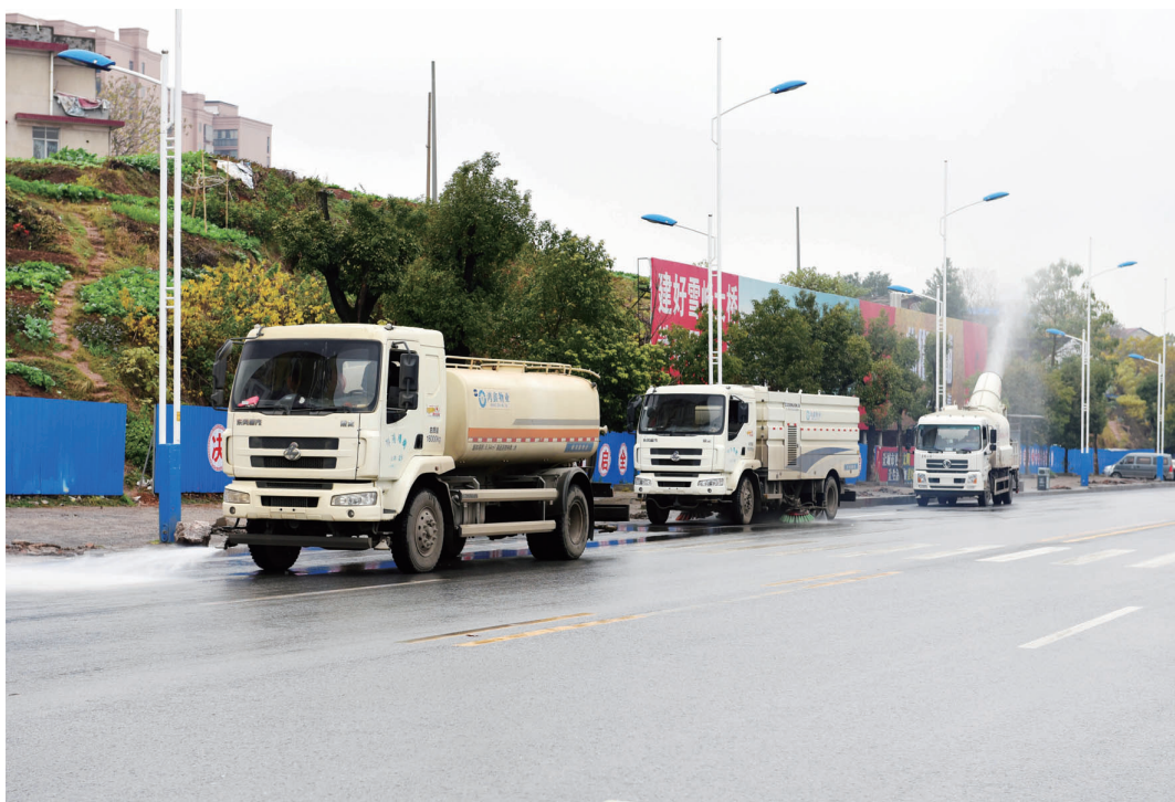
各种环卫车辆联合作业