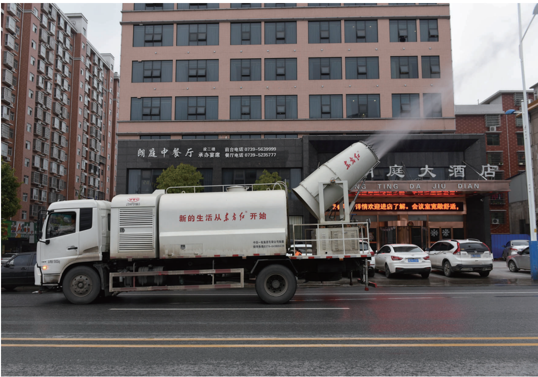
喷雾抑尘车作业,可大大减少道路扬尘。

逐步搬离主城区。截至11月底,全市325家粘土砖厂已全部关停,关停到位率100%,其中取缔301家,转型12家,整治到位96.31%。粘土砖厂关闭后,各县市积极开展土地复垦工作。