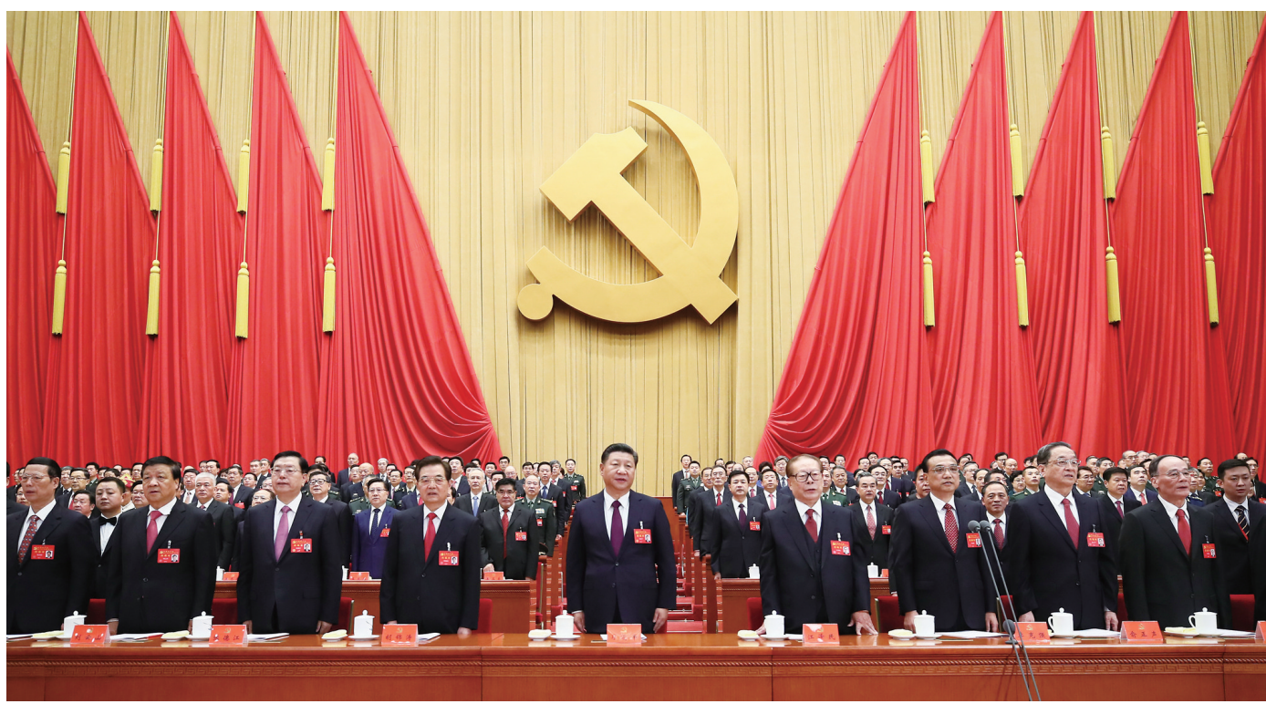
习近平、李克强、张德江、俞正声、刘云山、王岐山、张高丽、江泽民、胡锦涛在主席台上

新华社北京10月18日电 绘就伟大梦想新蓝图,开启伟大事业新时代。举世瞩目的中国共产党第十九次全国代表大会18日上午在人民大会堂开幕。