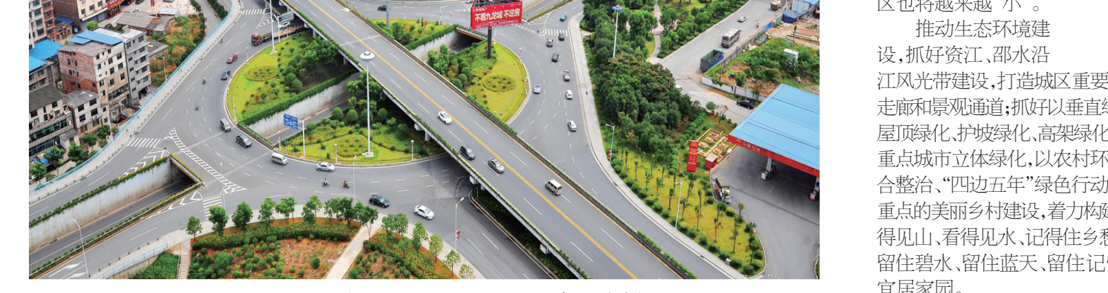
大祥立交桥成为城区重要的交通枢纽。

绿意葱茏、水波清澈,人影如织,随着西苑公园一期工程完工,这里就成为大祥区居民争相前往的地方。而当前和未来即将建设的滨江金融商贸新城、教育新城、体育新城、国家农业科技园区、蔡锷生态文化和宝庆古城旅游区、火车站高铁交通枢纽区,正如如荼地谱写着大祥区奋力发展的精彩篇章。大祥区“三城两区一枢纽”的战略构想已经起航,一系列强有力的发展举措,不断放大大祥区位优势新优势,构建大祥新未来。