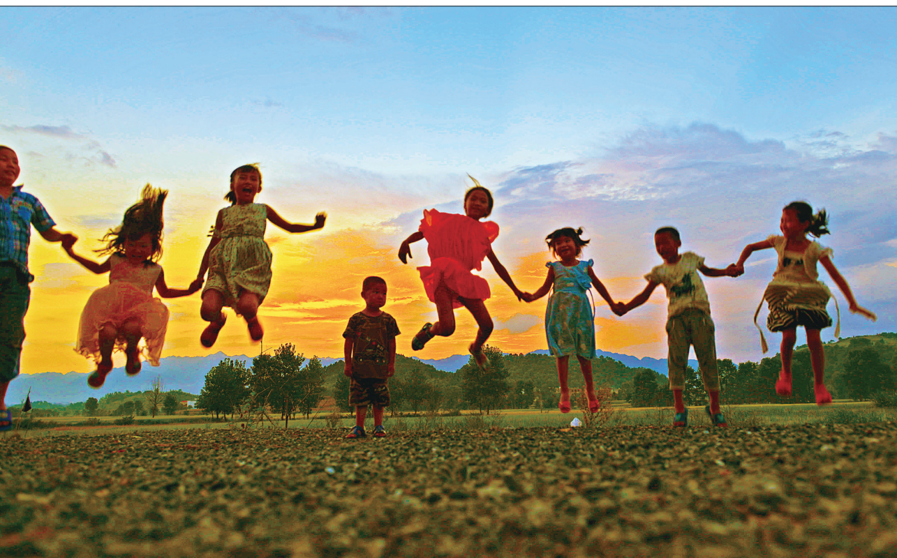
金秋的傍晚,西边的红霞挂满天空,武冈市铜湾村的孩子迎着晚风乐翻了天。