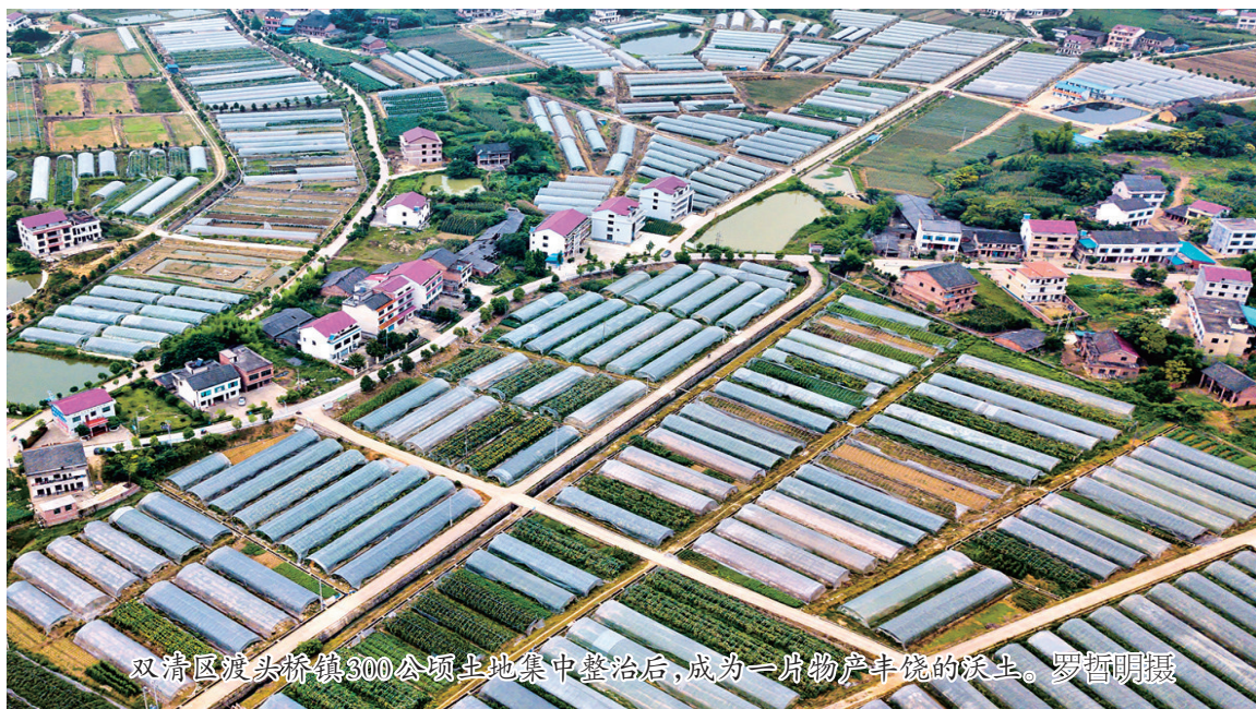
双清区渡头桥镇300公顷土地集中整治后,成为一片物产丰饶的沃土。

近年来,该局多次荣获全市国土系统绩效考核先进单位,并在新农村建设、招商引资、综合治理等工作上获评双清区先进单位。