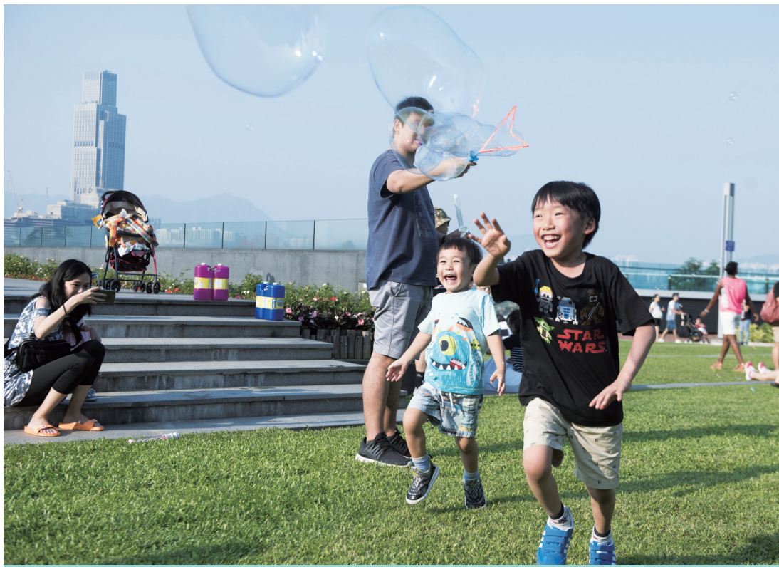
香港回归二十周年·新华视界

教育部要求,各高等学校要深入实施高校招生“阳光工程”,加强2017年普通高校招生和宣传工作,确保信息的准确性和时效性,积极、主动做好网上咨询。