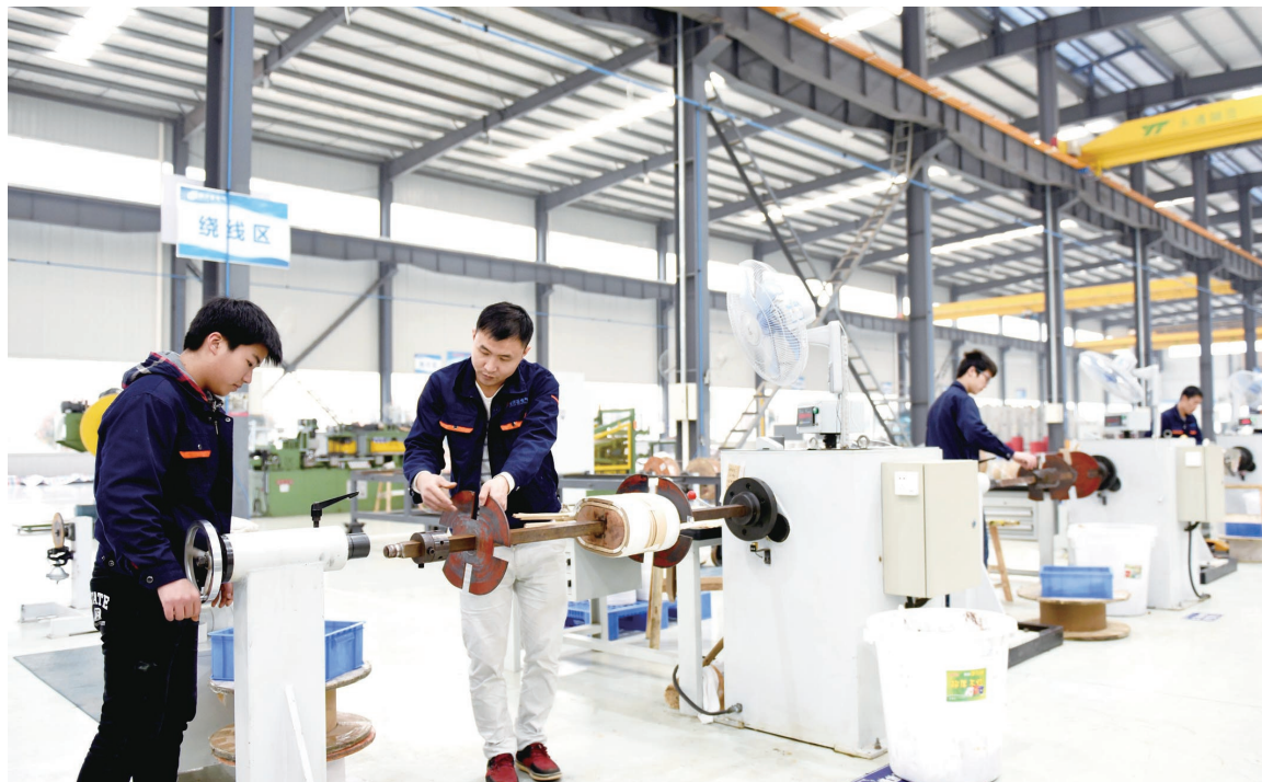
图为湖南德沃普电气股份有限公司生产车间一角。

3月下旬,走进位于邵东县城东部的生态产业园,热火朝天、紧张忙碌的生产场景,令人强烈感受到这里奋力发展的铿锵步伐。