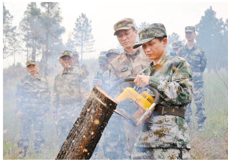
民兵练习使用电锯。