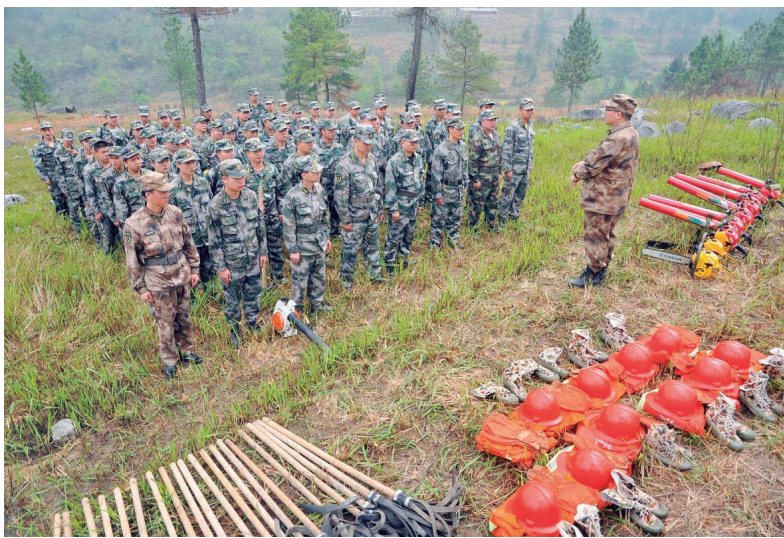
教练员正在进行灭火要领讲解。