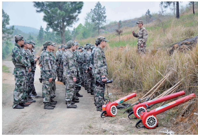
训练结束,教练员对当日训练进行总结。

根据春耕生产和森林防火的实际需要,大祥区武装部4月6日至4月15日开展为期10天的民兵森林防火分队训练。