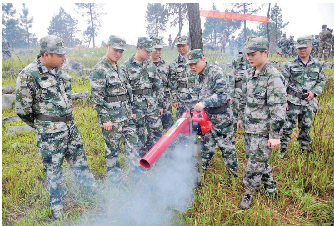
学习使用风力灭火器。