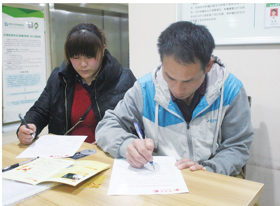
图为小良父母在器官捐赠书上签字。

3月6日晚上22时许，邵阳爱尔眼科医院医生来到新宁县回龙寺镇一栋民房里，将刚刚离世的小良(化名)捐献的一对眼角膜成功摘取并小心翼翼地保存，以便移植给其他有需要的患者。3月7日下午，小良捐献的一只眼角膜，成功移植到一名病毒性角膜炎患者的身上。