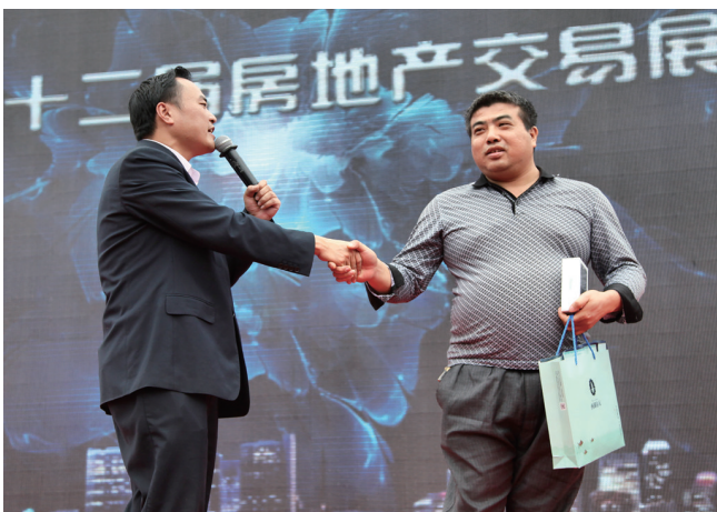
购房市民抽奖获得苹果手机