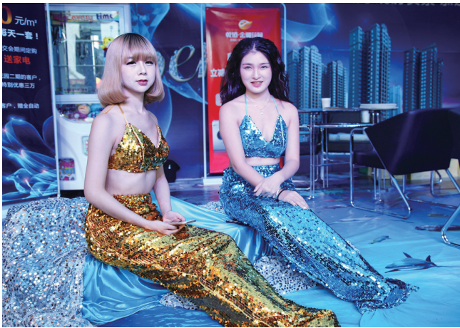
“美人鱼”助阵楼盘现场展示

伴随城市建设的推进和人民生活水平的提高,邵阳市房地产交易展示会已经举办到了第十二届。