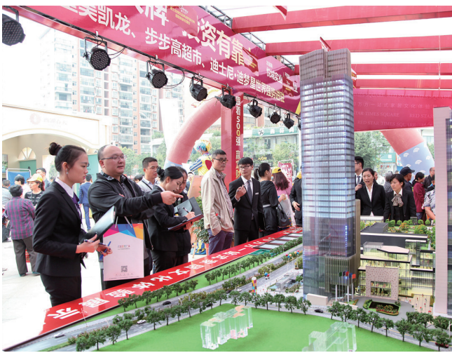
市民在了解商铺和楼盘信息

商业地产的大出风头,反映出人们在生活水平提高的同时,有了更为旺盛的投资置业需求。这与当前“大众创业、万众创新”的时势背景不无关联。在劲推“全民投资产品”等概念的同时,各商业地产商更是乘此房交会东风,以特价商铺、买铺送礼等优惠活动,为“财富洼地”招聚更多的吸引力和影响力。10月14日下午,一对中年夫妻当场就持各自的身份证,在大汉·悦中心定购了两间铺面。“我在附近进行车辆保养,知道这里开房交会,特意过来看一看,看中了就买了。”男方说得轻描淡写。