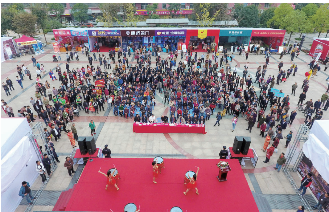
开幕式现场人气火爆

在创“国卫”工作令城市灿然蝶变、一度低迷的楼市正在回暖、房地产市场不断洗牌升级的新常态下,本届房交会注定拥有更多美好元素,让人们对家园生活有了更美好的感受和期待。