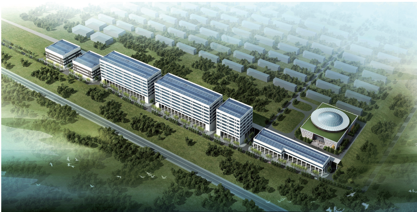
▲廉桥药都医药仓储物流基地

扼守宝庆东大门的楮塘铺,100多年前便开设了20多家药栈,60多年前更名廉桥,30多年前形成颇具规模的中药材市场。上世纪90年代中后期,廉桥中药材市场不断发展壮大,一度与河北安国、安徽亳州齐名,赢得“南国药都”的美称。时序新世纪,随着320国道的全面硬化改造,特别是沪昆高速的新建和娄邵铁路的扩改后,廉桥区位优势大为改观,中药材市场日益兴盛。2016年10月,因药兴镇的廉桥一跃成名,跻身全国127个“特色小镇”行列。